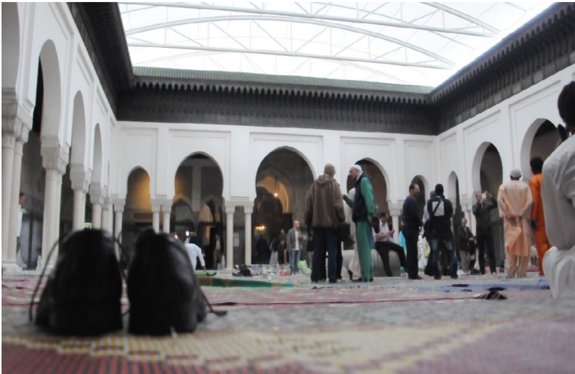
l'aspect de la Grande Mosquée pendant le Ramadan

« Pratiques alimentaires et festives du mois de Ramadan à Paris »